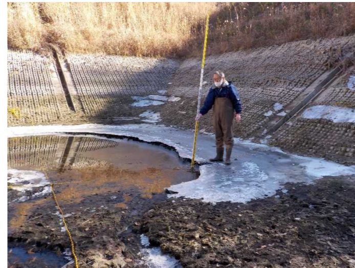
【地点①で計測をしている状況】