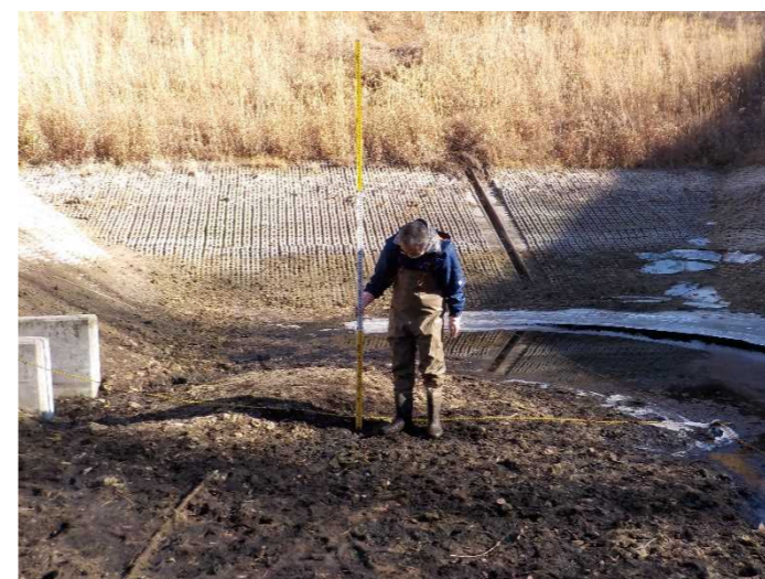
【地点③で計測をしている状況】