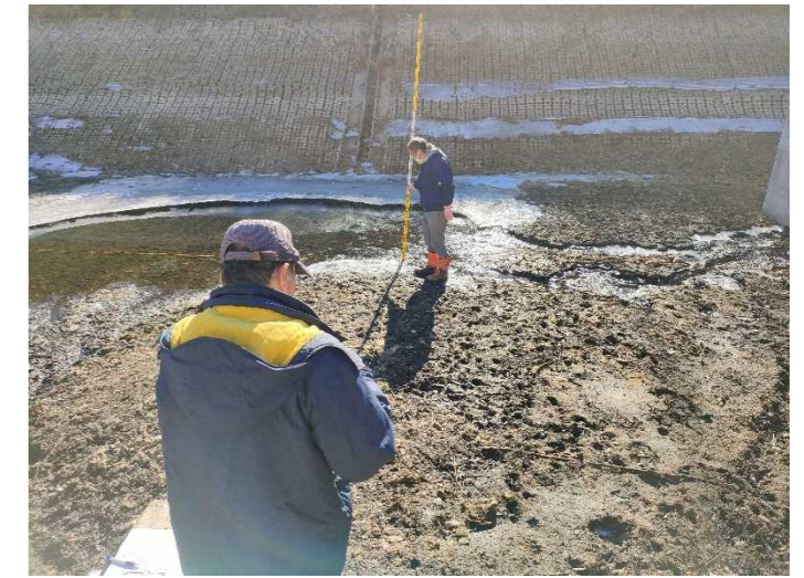
【中心点で計測をしている状況】