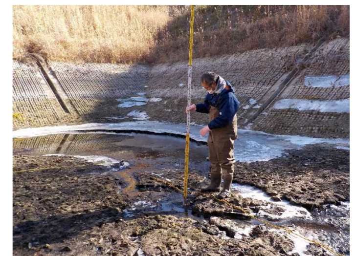
【地点②で計測をしている状況】