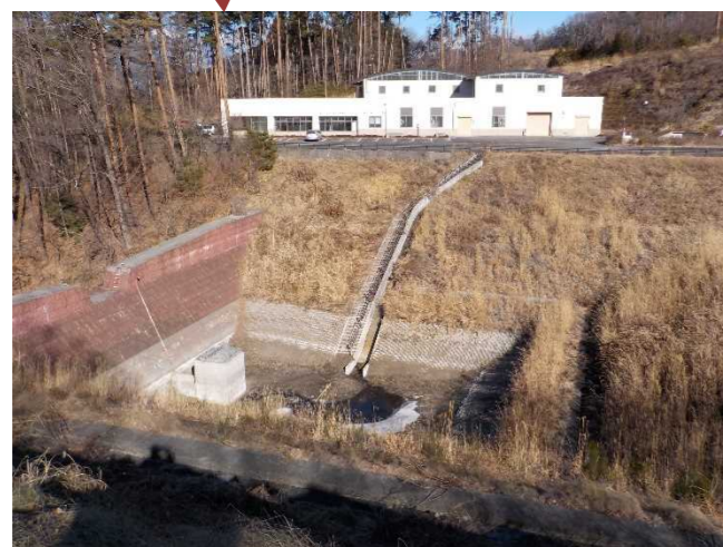
【防災調整池の全景】