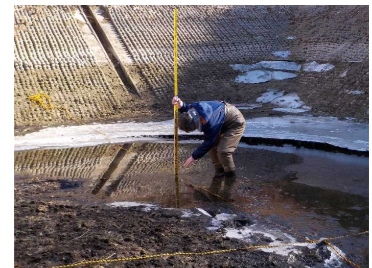
【地点④で計測をしている状況】