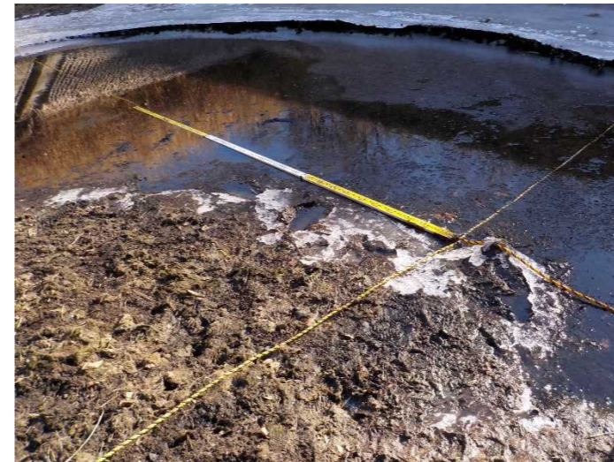
【中心点と各測定点の確認】