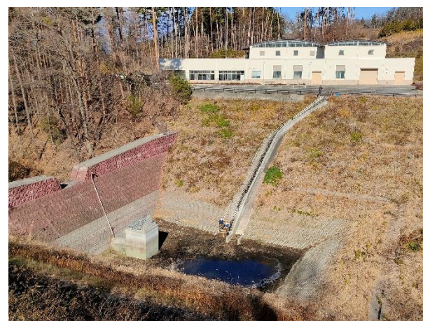
【防災調整池の全景】