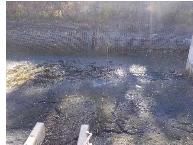
【各測定地点の確認】