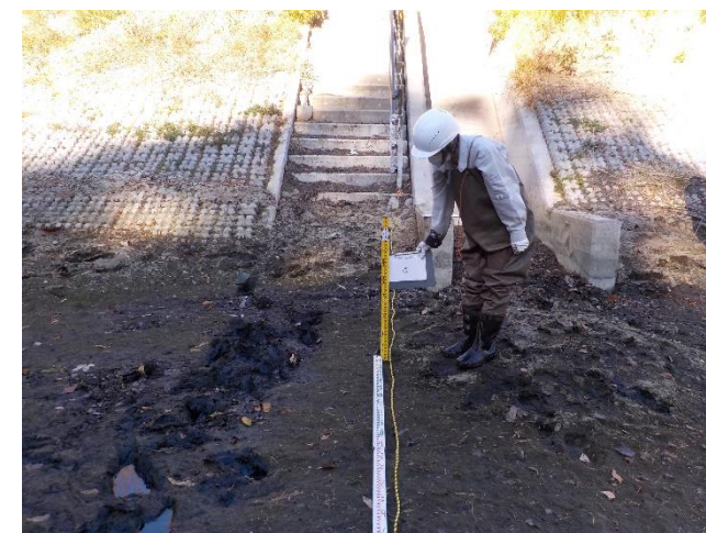
【地点③で計測をしている状況】