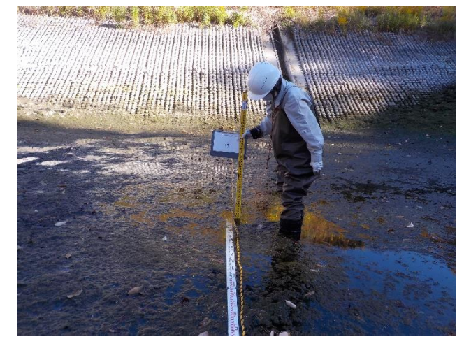
【地点④で計測をしている状況】