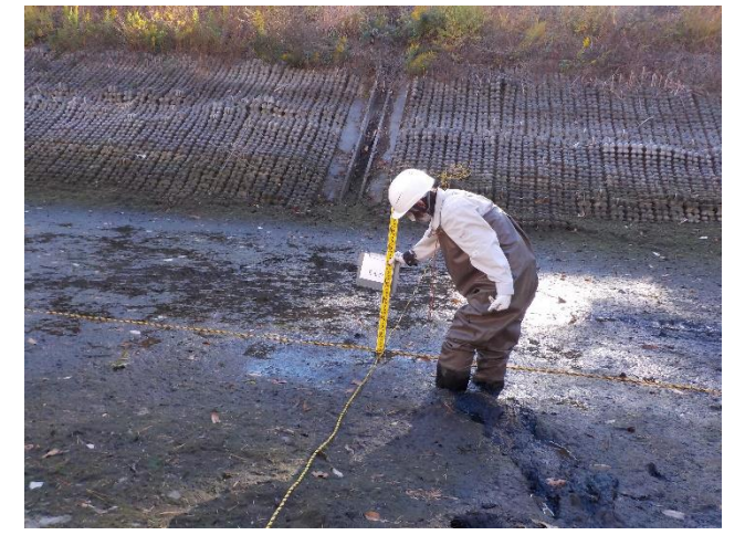
【中心点で計測をしている状況】