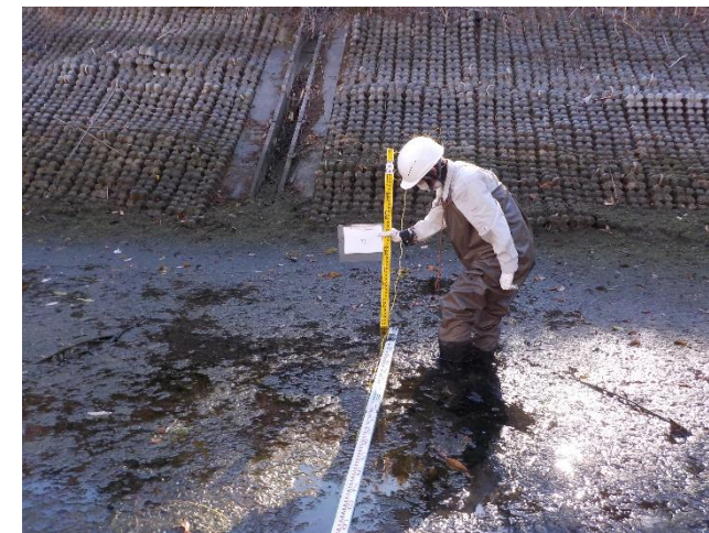
【地点①で計測をしている状況】