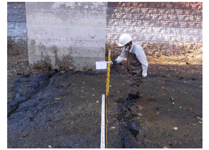
【地点②で計測をしている状況】