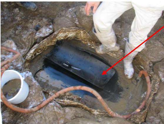
【上層遮水シートの仮溶着・上層不織布仮敷設】