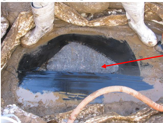
【下層不織布の仮敷設】