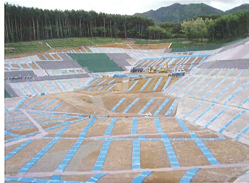
④ 埋立予定地(下流より望む)