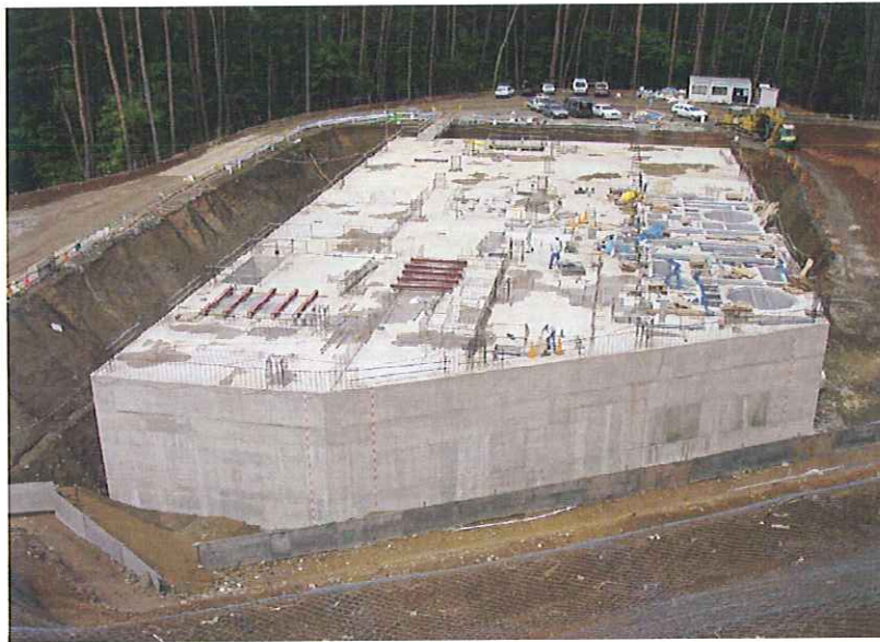
③ 浸出水処理施設敷地(調整槽)