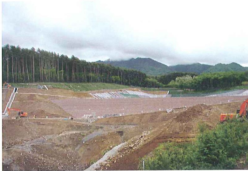
① 全景(下流より望む)