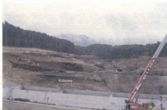
埋立地全景（下流より望む）