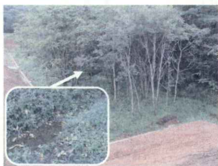
野生動物の「水場」を保存