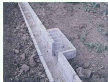
小動物に配慮した側溝からの出口