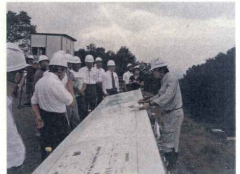
(建設現場視察状況)