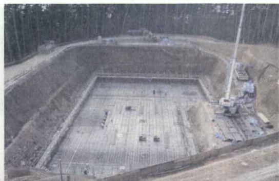
浸出水処理施設（調整槽）